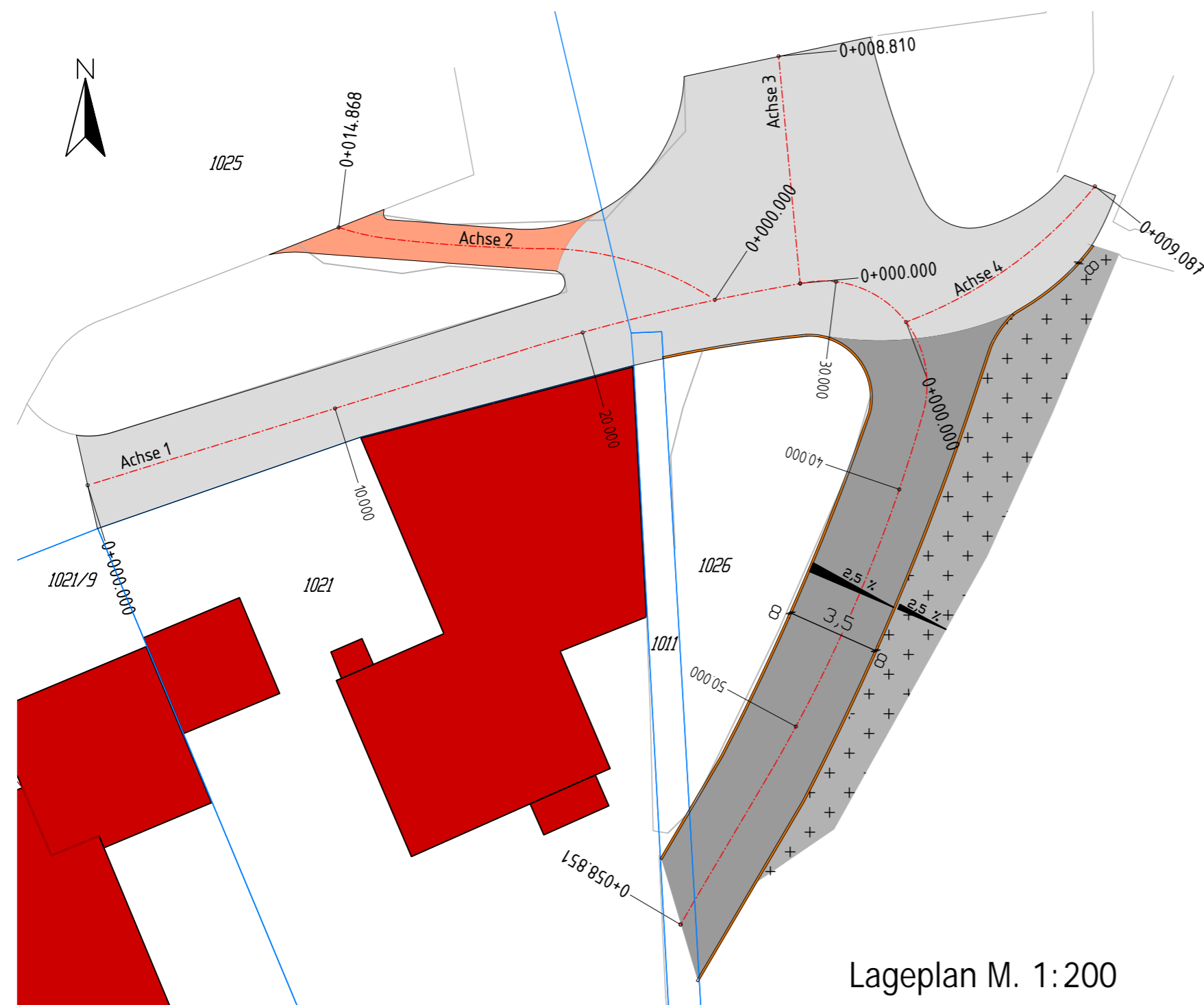
Lageplan M. 1:200